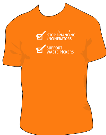
Camiseta para la COP17